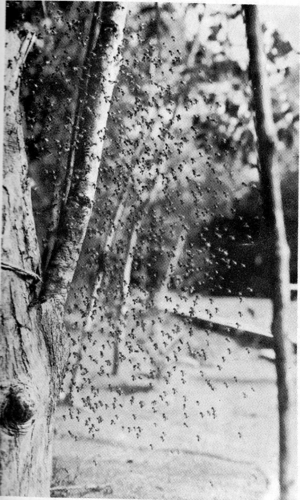
Fig. 1 — Início da formação do baile em Melipona rufiventris cf. paraensis Ducke. As abelhas mantêm-se ainda em posição de frente para tronco povoado. A entrada está localizada no terço inferior junto ao nó lateral do tronco. (Fotografia do autor).

Em meliponário, o baile, é formado aproximadamente, a um metro de altura do solo e o movimento de ar descendente, que se forma, estende-se em redor, numa área que pode atingir mais de seis metros de diâmetro. A presença de observadores não afeta a continuação do fenômeno, mesmo introduzindo a